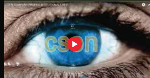
Clicca sulle Immagini