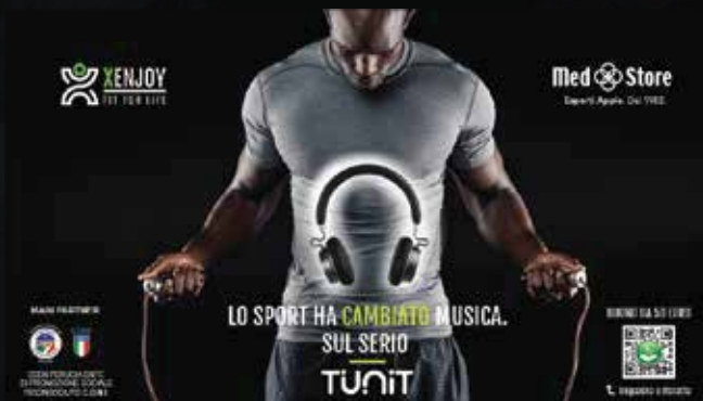
Immagine coordinata Interattiva in negozio Depliant in 20,000 Sponsorship RSD Palestre C.O.N.I

Tutte alcuni esempi di comunicazione interattiva in negozio