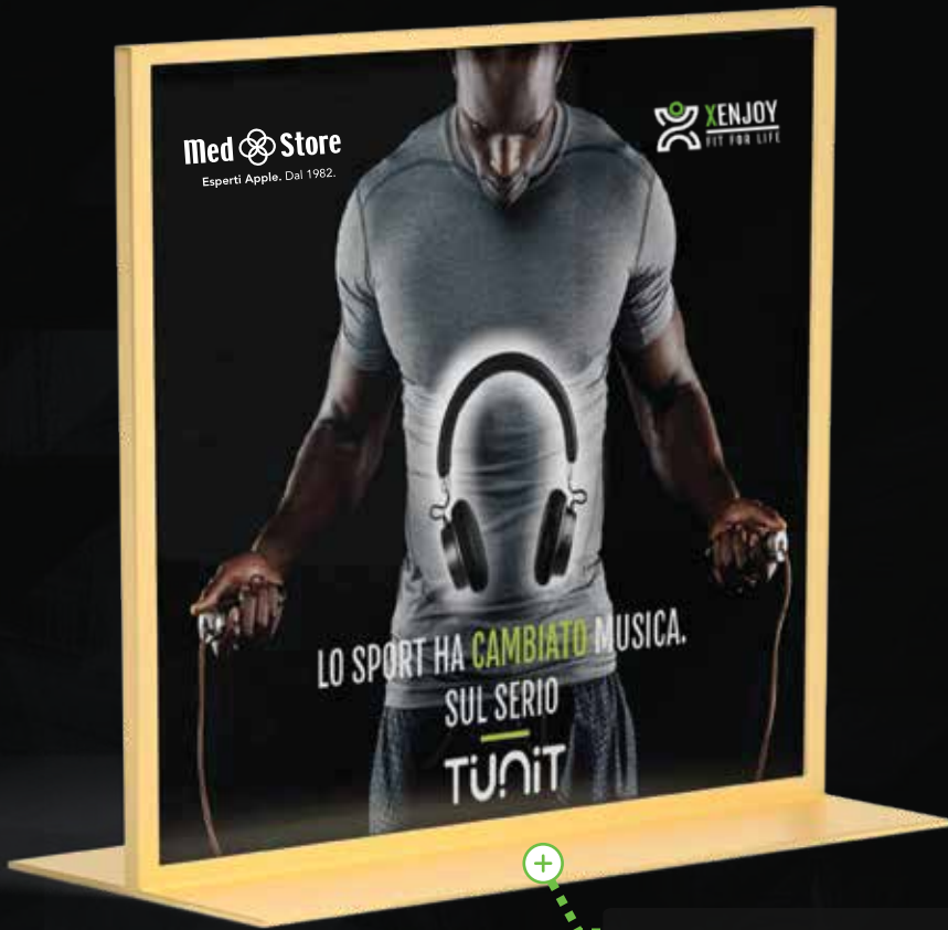
IMMAGINE COORDINATA INTERATTIVA PER NEGOZIO